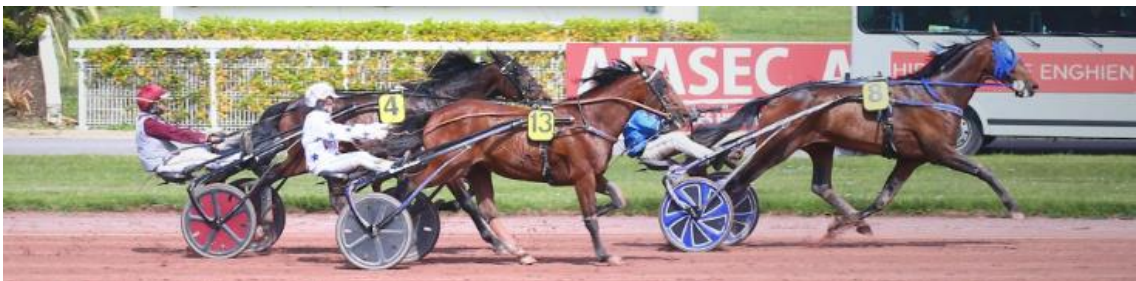
Prix de l’Atlantique 2023 IRL, Victoire de Horsy Dream !